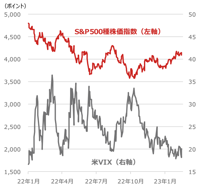
S&P500種株価指数と米VIX （ボラティリティ・インデックス）

期間：2022年1月3日～2023年2月16日、日次 ・ボラティリティ・インデックスとは米シカゴ・オプション取引所が、S&P500種株価指数を対象とするオプション取引の変動率を元に算出、公表している指数。一般的に同指数の数値が高いほど、投資家の先行き不透明感が強いとされる。（別名：恐怖指数） （出所）Bloombergより野村アセットマネジメント作成