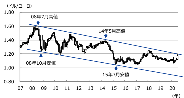
【図表2：ユーロドルの推移】

(注) データは2007年1月から2020年7月。ローソク足は月足。 (出所) Bloomberg L.P.のデータを基に三井住友DSアセットマネジメント作成