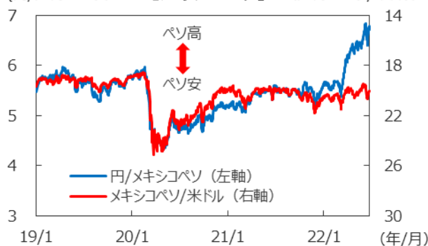
【メキシコペソ】 (円/メキシコペソ) (メキシコペソ/米ドル)