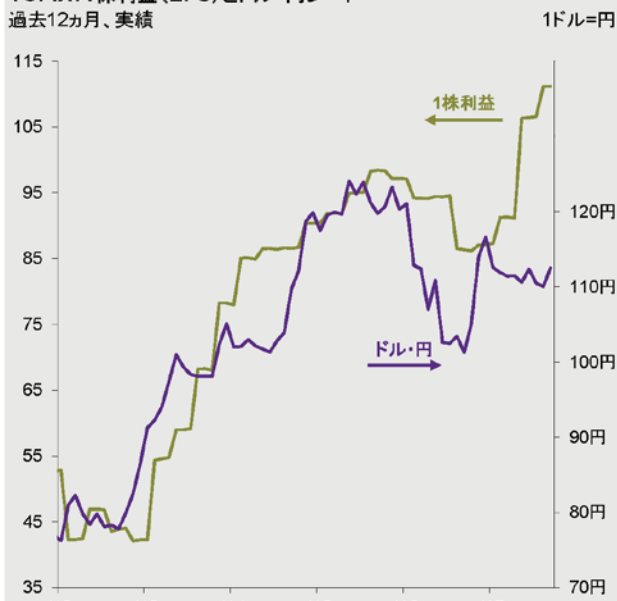
TOPIX: 1株利益 (EPS) とドル・円レート 過去12ヵ月、実績