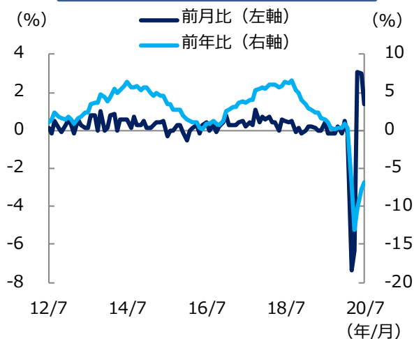
米景気先行指数の推移