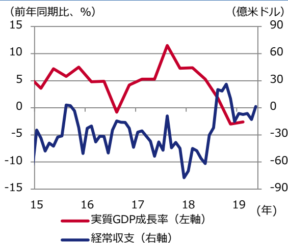
図表2 実質GDP成長率と経常収支の推移

期間：2015年1-3月期～2019年1-3月期(実質GDP成長率、四半期) 2015年1月～2019年5月(経常収支、月次) 出所：データストリームのデータを基にアセットマネジメントOneが作成