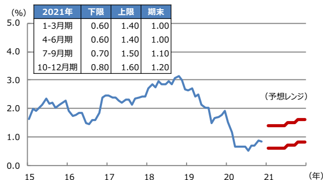
【図表2：米国10年国債利回りの予想レンジ】

(注) データは2015年1月から2020年11月。月末値を使用。2020年12月18日時点の三井住友DSアセットマネジメントによる予想。太線は予想レンジの上限と下限。