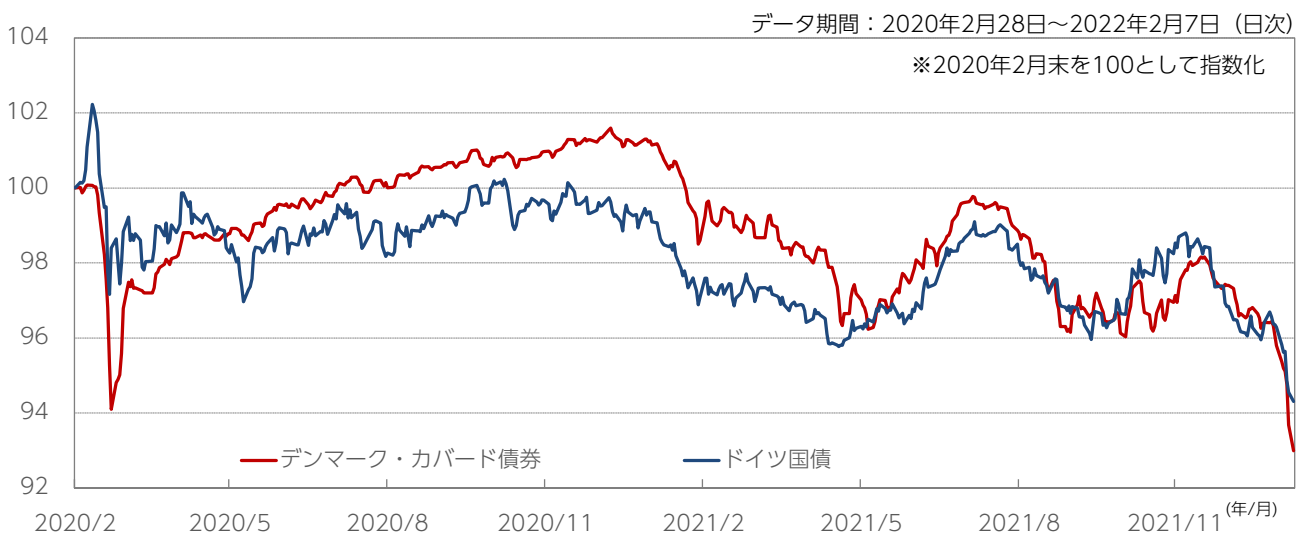
図表1：欧州(ドイツ)国債とデンマーク・カバード債券の推移

デンマーク・カバード債券：ニクレディットDMBトータルリターンインデックス(現地通貨ベース) ドイツ国債：FTSE世界国債インデックスの各国国債インデックス(トータルリターン、現地通貨ベース)