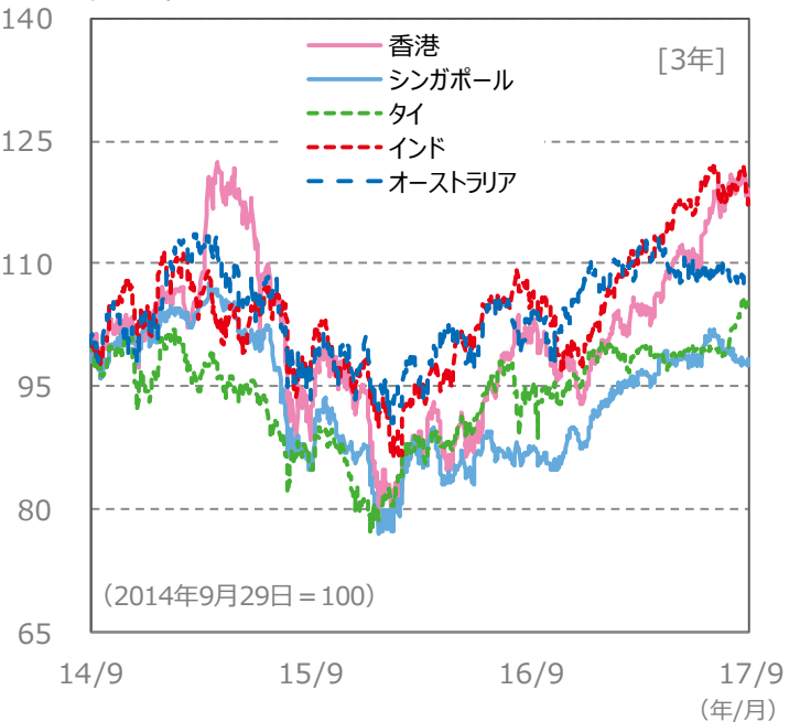
【国・地域別の株価指数の推移】