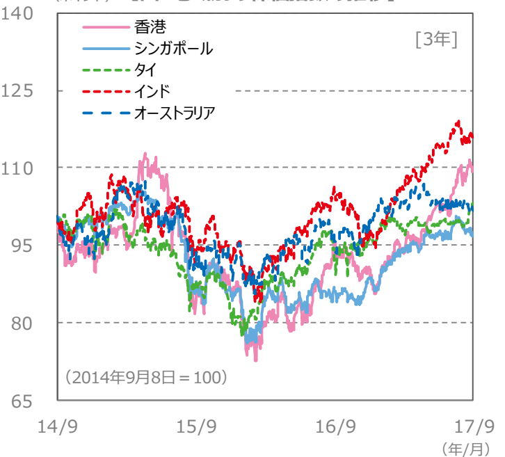
(ポイント) 【国・地域別の株価指数の推移】 [3年]