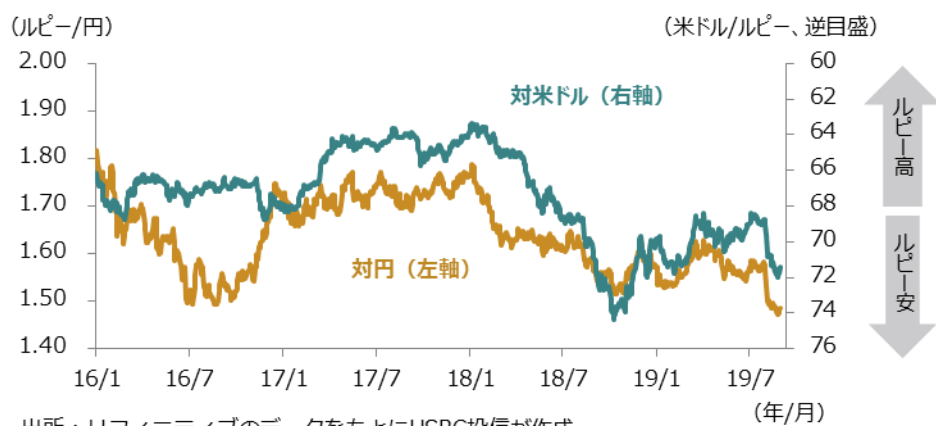
図表3 ルピー相場の推移（2016年1月1日～2019年8月30日）