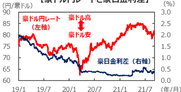
【豪ドル円レートと豪日金利差】