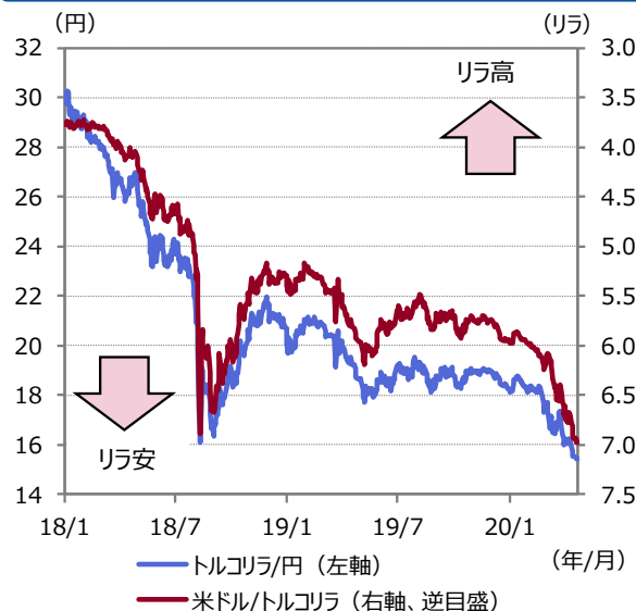
図表2 トルコリラの推移

期間：2018年1月2日～2020年4月22日（日次）