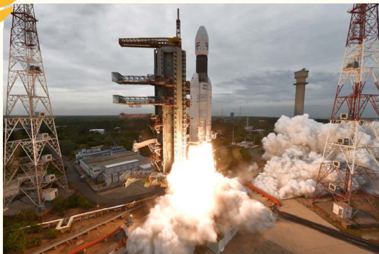
チャンドラヤーン2号の打ち上げの風景