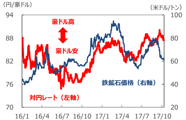
【鉄鉱石価格と豪ドルの対円相場】

(注) データは2016年1月1日～2017年10月10日。