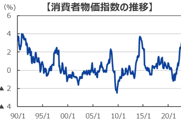
【消費者物価指数の推移】

(注) データは1990年1月～2022年8月。前年同月比年率。(年/月)