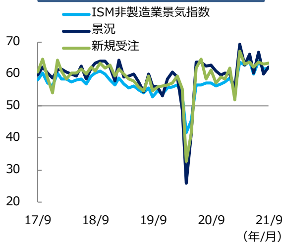
ISM非製造業景気指数の推移（1）