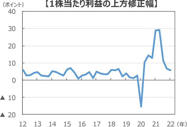
【1株当たり利益の上方修正幅】

(注) データは2012年1-3月～2022年1-3月。上方修正幅は実際の伸び率と1カ月前の予想伸び率との差。S&P500種指数採用企業ベース。 (出所) Bloomberg、FactSetのデータを基に三井住友DSアセットマネジメント作成