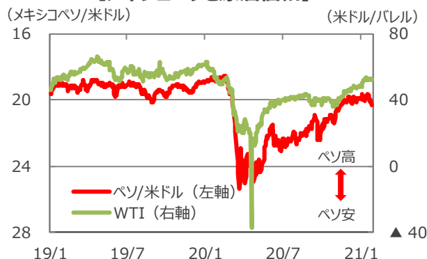
【メキシコペソと原油価格】

(出所) Bloomberg L.P.のデータを基に三井住友DSアセットマネジメント作成