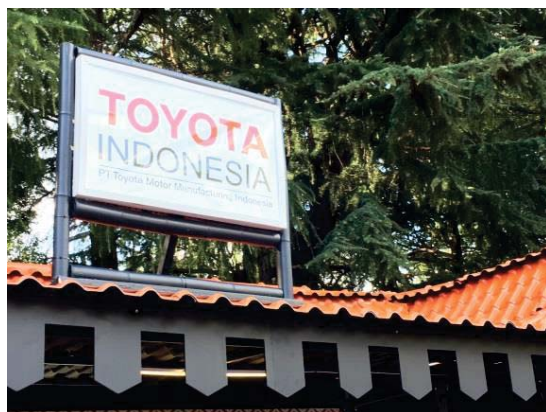
<TOYOTAインドネシアのブース>