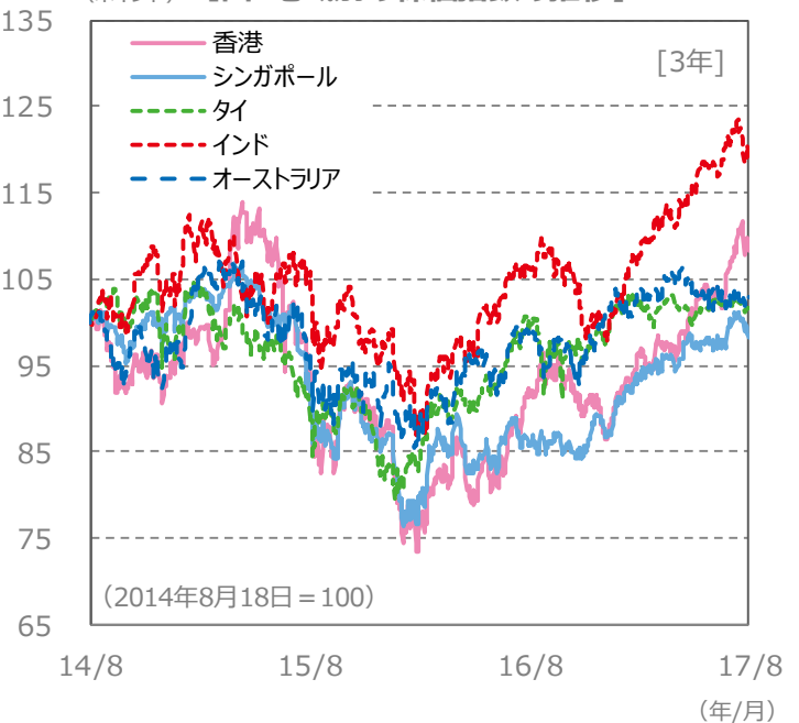
(ポイント) 【国・地域別の株価指数の推移】 [3年]