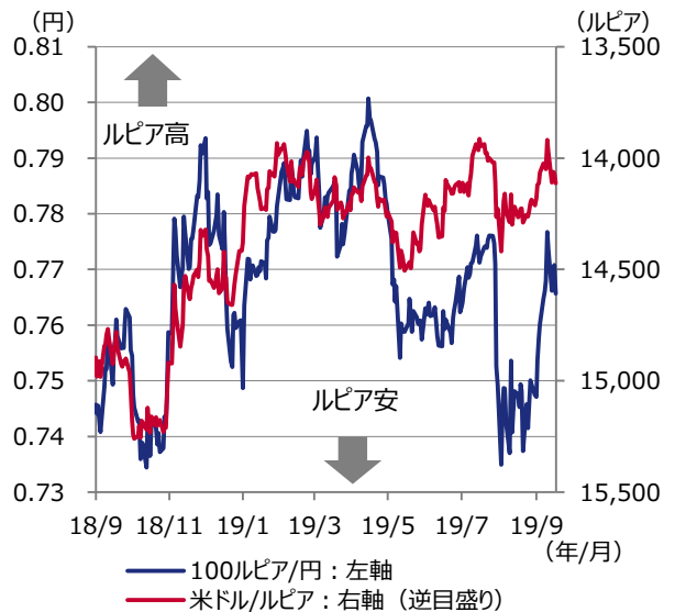
図表2 インドネシアルピアの推移

期間：2018年9月3日～2019年9月19日（日次）