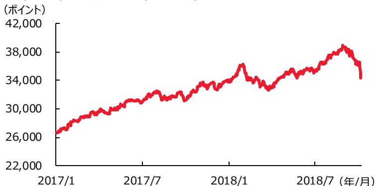
SENSEX指数の推移（2017年1月1日～2018年10月5日）