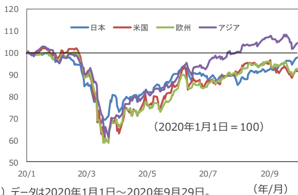
【各国・地域の小型株の動向】