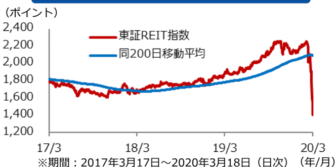
東証REIT指数と投資主体別売買状況の推移