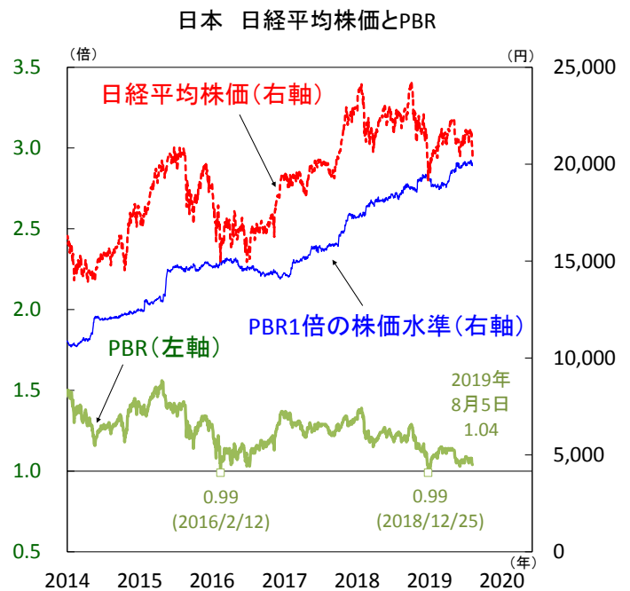
【図3】日本株の割安感が一段と強まる、PBRが1倍割れとなれば底堅い動きに