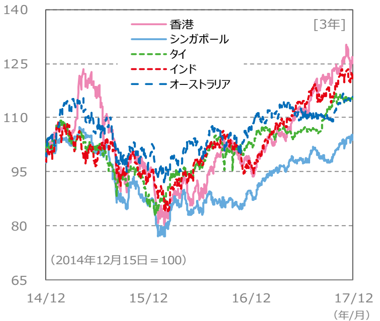
【国・地域別の株価指数の推移】