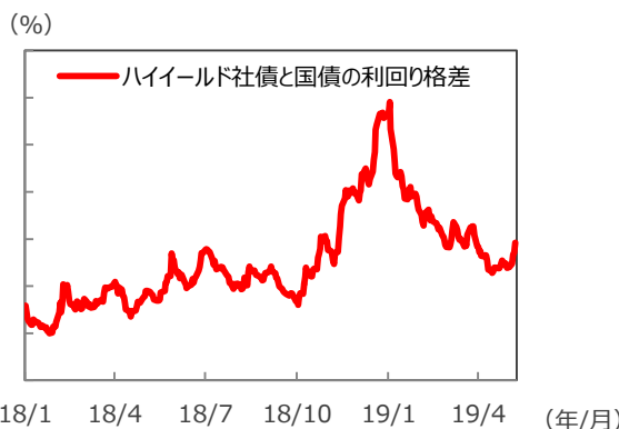
【ハイールド社債と国債の利回り格差】