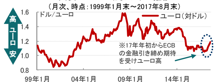
図表2：ECBスタッフの主な経済予想の推移