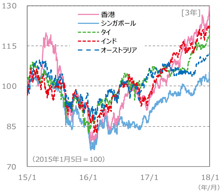
(ポイント) 【国・地域別の株価指数の推移】 [3年]