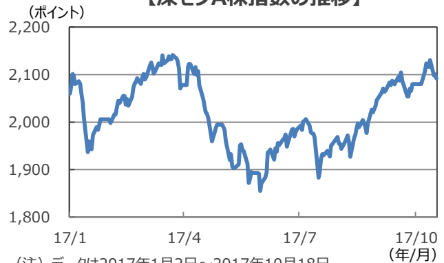
【深センA株指数の推移】

(注) データは2017年1月2日～2017年10月18日。 (出所) Bloomberg L.P.のデータを基に三井住友アセットマネジメント作成