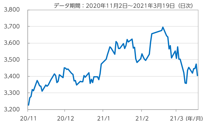
図表3：中国主要都市の中古住宅価格の推移