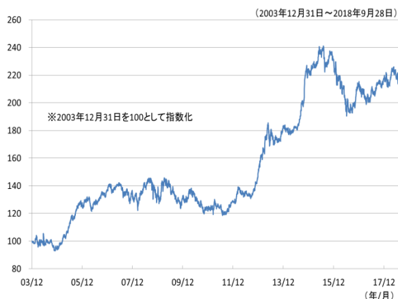
【図表2】中国国債のパフォーマンス推移（円ベース）

※中国国債：J.P Morgan GBI-EM China Unhedged JPYを使用