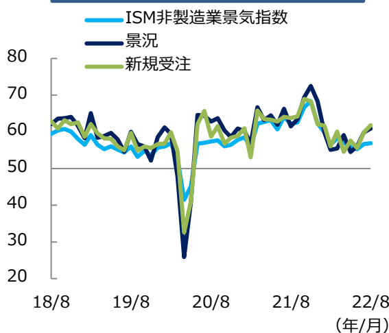
ISM非製造業景気指数の推移（1）

こうしたことから、ISM非製造業景気指数は予想外に上昇したものの、今後の動向に注視が必要です。