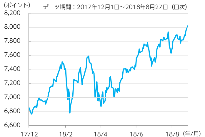
図表1：ナスダック総合指数の推移