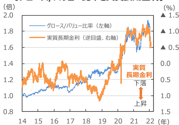
【グロース/バリュート率と実質長期金利】

(注) データは2014年1月2日～2022年1月28日。グロース/バリュート率はS&P500グロース指数÷同バリュート指数。2014年1月2日=1。実質長期金利は米10年国債利回りー期待インフレ率。