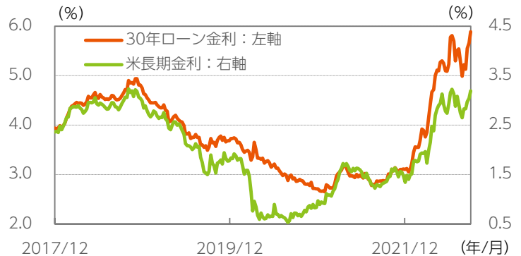
図表2：住宅ローン金利は11年ぶりの高水準に

データ期間：2017年12月31日～2022年9月2日(週次) ※米国10年国債の利回りと住宅ローン(30年固定)金利の推移