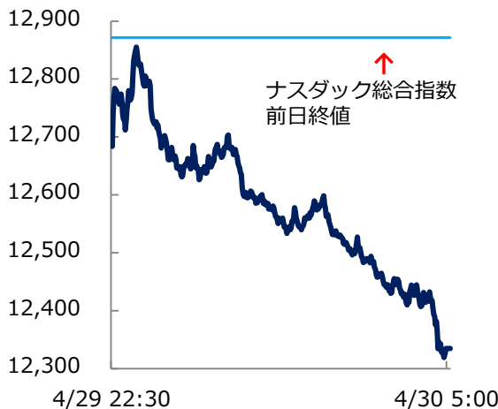
4月29日のナスダック総合指数の推移