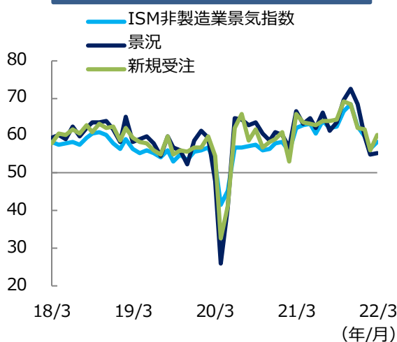
ISM非製造業景気指数の推移（1）