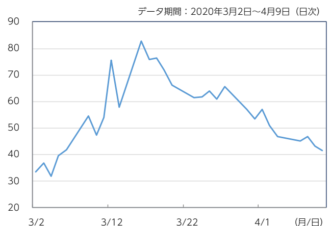
図表3：世界株式と世界REIT