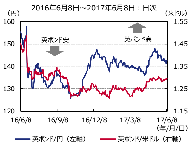
図表2 英ポンドの推移