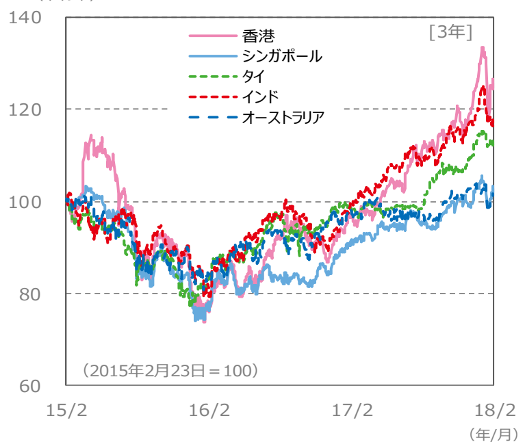
【国・地域別の株価指数の推移】 [3年]