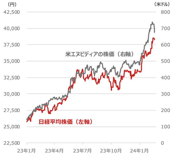
日経平均株価と米エヌビディアの株価

期間：2023年1月4日～2024年2月21日、日次 （出所）Bloombergより野村アセットマネジメント作成