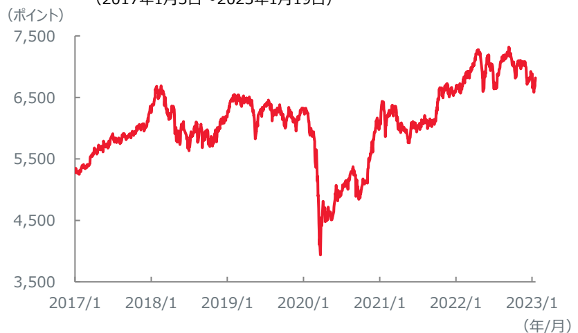
【株式】 ジャカルタ総合指数の推移 (2017年1月3日～2023年1月19日)