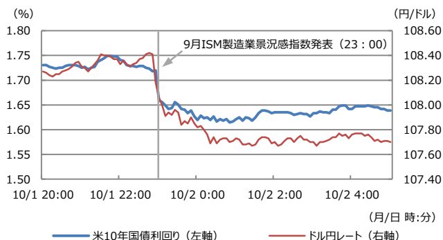
【図表1：米10年国債利回りとドル円レート】

(注) データは2019年10月1日20:00から10月2日5:00。日時は日本時間。