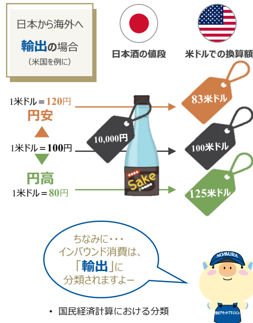
上記はイメージ図です。全てを説明したものではありません。

円安・円高の影響要因は様々ですが主に金利や物価変動、国際収支が挙げられます。一般的に低金利、物価上昇、国際収支赤字などが主な円安要因とされています。