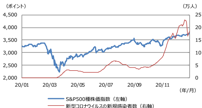
【図表1：米国における株価と新規感染者数の推移】

(注) データは2020年1月2日から12月31日。新規感染者数は2020年1月29日から、7日間の移動平均