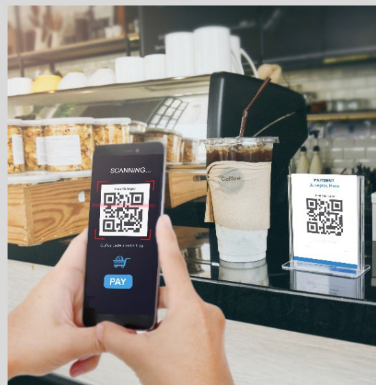
上記はイメージです。

日本国内におけるQRコードの決済額は2019年度には6,000億円に達する見込み* であり、今後も2020年に向けたインバウンド需要拡大や政府のキャッシュレス推進方針の後押しを受け、 2023年には2019年の13倍以上の8兆円規模となると予測 されています。