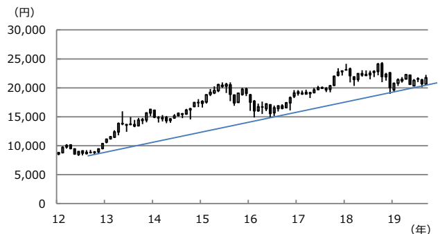
【図表2：日経平均株価の下値支持線】

(注) データは2012年1月から2019年9月。下値支持線は2012年10月安値と2016年6月安値を結んだ線。