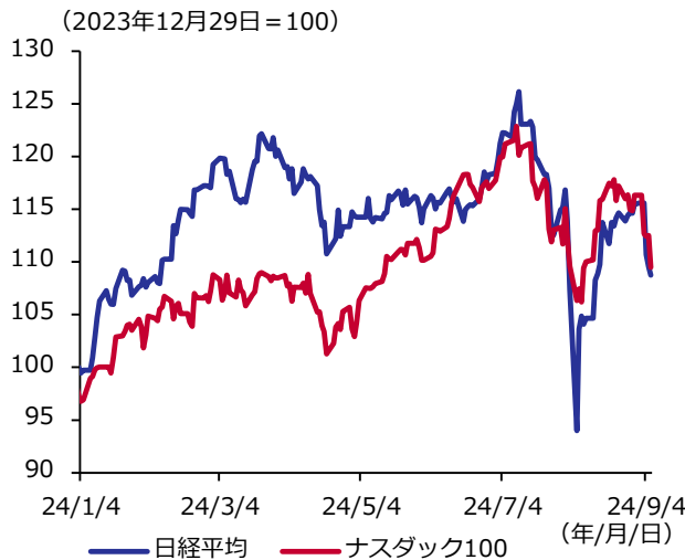
図表1 日経平均とナスダック100

期間：2024年1月4日～9月6日（日次）